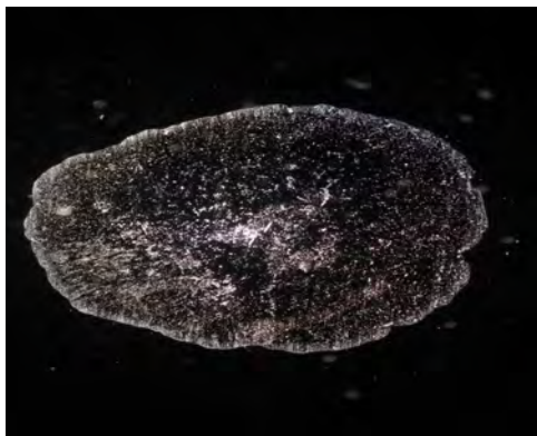
Leitungswasser Salem 8.11.2019

Untersucht wurde im Vergleich das Leitungswasser aus einem Haushalt in Salem in der Nähe von Überlingen unbehandelt und nach Durchlauf durch eine Kombination von einem Aqua Global Umkehrosmosegerät und einem Pejosan Wasserwirbler. Das strukturelle Tropfenbild veränderte sich in allen Tropfen sehr deutlich: